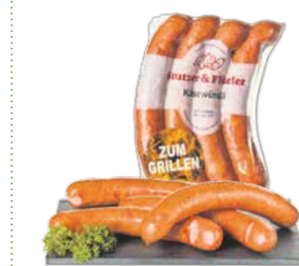
Das Chäswürschtli der Metzgerei Stutzer & Flüeler in Kerns.